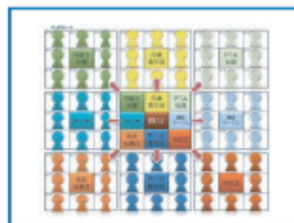
③各グループや団体それぞれに8名の名前をいれて完成